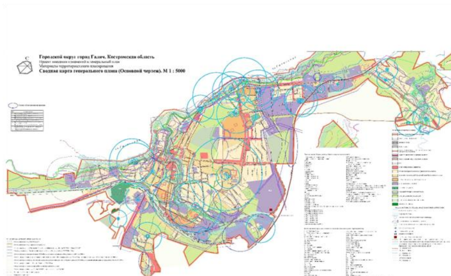
Сводная схема генерального плана. Основной чертеж.

Приложение №2 к решению Думы городского округа - город Галич Костромской области от « 27 » января 2022 года № 129